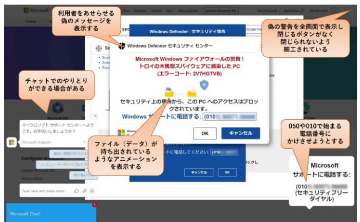
最近の口口で確認された偽のセキュリティ警告画面の例(※体験サイトとは異なります)

KEEP OUT KEEP OUT KEEP OUT KEEP OUT KEEP OUT